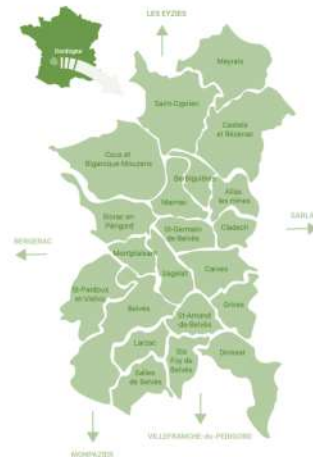
Communauté de commune Dordogne Forêt Bessède

Depuis l'association s'inscrit comme un acteur de la transition écologique en Dordogne en co-construisant auprès de publics variés des ateliers autour du vivant.